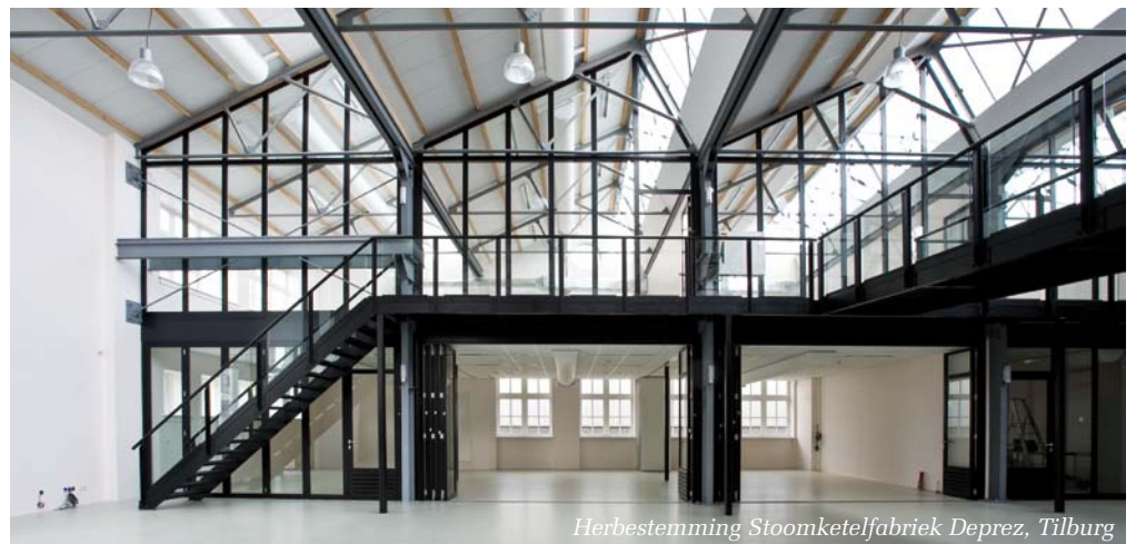
Herbestemming Stoomketelfabriek Deprez, Tilburg

De actualiteit van dit moment illustreert dit. Zo werd op 12 oktober 2011 het jaarlijkse RCE-symposium geheel gewijd aan Duurzame Monumentenzorg. Een dag lang werd het thema duurzaamheid belicht vanuit het perspectief van restaureren en in