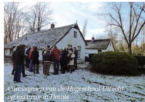
Circusgroep van de Hogeschool Utrecht op excursie in Drenthe

De leergang bestaat uit de onderdelen historie en geografie, monument en omgeving, beleid, regelgeving en financiën, communicatie, cultuurhistorische waarden en ruimte voor erfgoed. Er wordt aandacht besteed aan de meest recente ontwikkelingen. De opleiding is vooral bestemd voor hen, die (al) werkzaam zijn bij een bouwbedrijf, een gemeente of bijvoorbeeld een woningcorporatie.