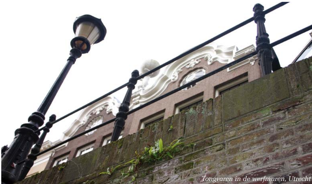
Tongvaren in de werfmuren, Utrecht

vooraf aan een restauratie niet te willen laten uitvoeren. Als het werk moet worden stilgelegd, kost het de restauratie-aannemer en de opdrachtgever waarschijnlijk meer”. Uit de scan bleek dat er zich verschillende kleine en grote populaties van beschermde plantensoorten in de muren bevonden. Tijdens de restauratie zijn op veel plaatsen in de muur de bronpopulaties ontzien. De rest van de plantjes zijn verplaatst. David van Raaij en Wim Vuik van de gemeente Utrecht zijn dan ook blij met de versoepeling van de Flora- en Faunawet. “Er wordt nu gesproken over een zorgplicht, dus het terugbrengen van planten op andere plaatsen dan de oorspronkelijke is geoorloofd”, meldt David van Raaij enthousiast. Vooral de beschermde Steenbreekvaren, Tongvaren, Gele Helmbloem en Klein Glaskruid hebben zich op de werfmuren in Utrecht geworteld. In tegenstelling tot de houtige gewassen, zoals boomwortels en klimop, dragen deze muurplanten zelf niet actief bij aan de achteruitgang van de onderhoudstoestand van de muren. Integendeel, de muurplanten en -bloemen leveren een belangrijke bijdrage aan de natuurwaarden in de stad Utrecht. ■