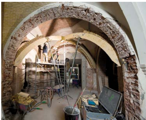
Restauratie Rijksmuseum, Amsterdam