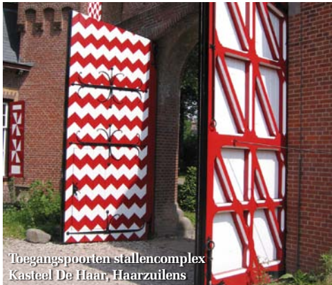
Toegangspoorten stallencomplex Kasteel De Haar, Haarzuilens

Omdat de bestaande KOMO-normeringen zich toespitsten op nieuwbouw ontstond er behoefte aan een duidelijke normering voor restauratietimmerwerk. Deze nieuwbouwnormeringen waren namelijk niet goed toe te passen in de monumentenzorg. Enkele jaren geleden hebben de initiatiefnemers van de Vereniging Timmerwerk Restauratie (VTR) samen met de Stichting Keuringsbureau Hout een KOMO-certificaat voor restauratietimmerwerk ontwikkeld. Inmiddels is gebleken dat dit VTR-certificaat aanslaat. De jonge branchevereniging telt al 15 leden, verspreid over het hele land. Door volgens vaste voorschriften te werken, wordt aan eigenaren van monumenten zekerheid geboden over de kwaliteit van het timmerwerk en het restauratievakmanschap. Ook is dit KOMO-certificaat opgenomen in het STABU-standaard bouwbestek. Het werken volgens de KOMO voor restauratietimmerwerk van de VTR levert een toegevoegde waarde op voor alle bij een restauratie betrokken partijen. Voor meer informatie: www.timmerwerkrestauratie.nl ■