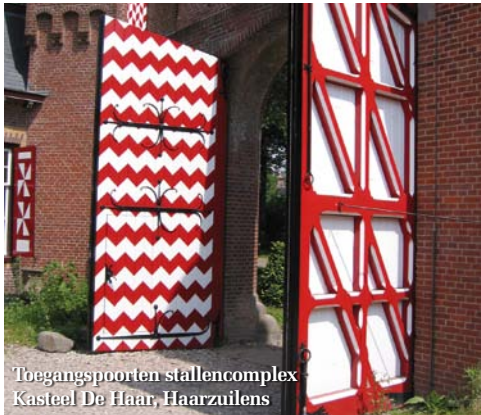
Toegangspoorten stallencomplex Kasteel De Haar, Haarzuilens

Omdat de bestaande KOMO-normeringen zich toespitsten op nieuwbouw ontstond er behoefte aan een duidelijke normering voor restauratietimmerwerk. Deze nieuwbouwnormeringen waren namelijk niet goed toe te passen in de monumentenzorg. Enkele jaren geleden hebben de initiatiefnemers van de Vereniging Timmerwerk Restauratie (VTR) samen met de Stichting Keuringsbureau Hout een KOMO-certificaat voor restauratietimmerwerk ontwikkeld. Inmiddels is gebleken dat dit VTR-certificaat aanslaat. De jonge branchevereniging telt al 15 leden, verspreid over het hele land. Door volgens vaste voorschriften te werken, wordt aan eigenaren van monumenten zekerheid geboden over de kwaliteit van het timmerwerk en het restauratievakmanschap. Ook is dit KOMO-certificaat opgenomen in het STABU-standaard bouwbestek. Het werken volgens de KOMO voor restauratietimmerwerk van de VTR levert een toegevoegde waarde op voor alle bij een restauratie betrokken partijen. Voor meer informatie: www.timmerwerkrestauratie.nl ■