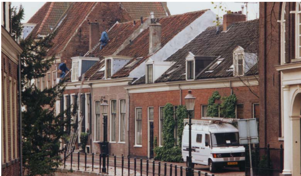
De monumentenwacht inspecteert een woonhuismonument aan de Lange Gracht in Amersfoort

In 1973 werden drie stichtingen Monumentenwacht opgericht: de Stichting Monumentenwacht Nederland, nog steeds gevestigd in Amersfoort, en de monumentenwachten voor de provincies Groningen