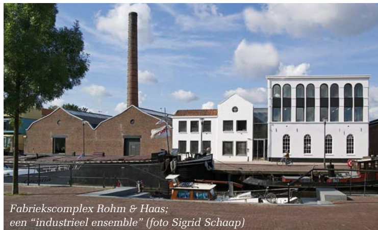
Fabriekscaplex Rohm & Haas; een "industrieel ensemble"

Het voormalige fabriekscaplex Rohm & Haas in Amersfoort krijgt een nieuwe toekomst. Nieuwe gebruikers, zoals een architectenbureau, een kunstenaarscollectief en een restaurant nemen hun intrek in de, dankzij de actieve inzet van onder andere Siesta, Zeep Architecten, BOEi en Aannemingsbedrijf H.J. Jurriëns BV, gerestaureerde fabriek. Achter de linker loods is een moderne aanbouw geplaatst. De schoorsteen uit 1927, die net achter de loods stond, is opgenomen in de nieuwbouw waardoor deze, heel