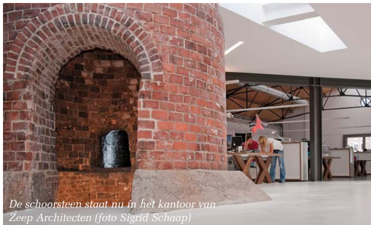
De schoorsteen staat nu in het kantoor van Zeep Architecten