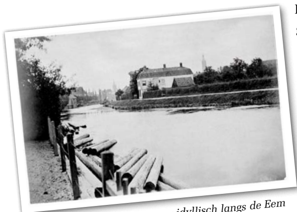
Huis Eemzicht ligt in 1870 nog idyllisch langs de Eem

Foto's en illustraties zijn aangeleverd door: René van den Burg, EIB, Sigrid Schaap, Archief Eemland, Luuk Kramer, Heijmans Beton- en Waterbouw - Restauratie.