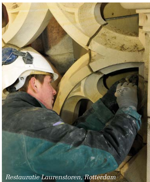
Restauratie Laurenstoren, Rotterdam