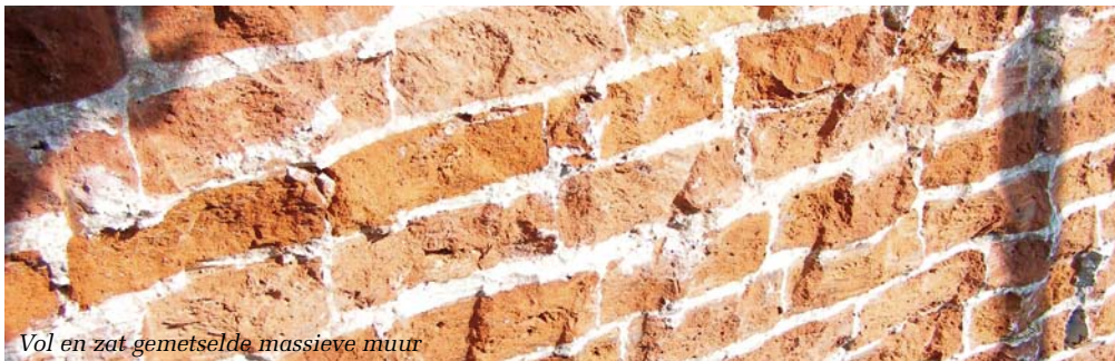
Vol en zat gemetselde massieve muur

In de tweede helft van 2011 zal onder auspiciën van het Nationaal Restauratie Centrum een eendaagse cursus worden gegeven, waarin het ‘vol en zat metselen’ en ‘doorgestroken voegen’ voor de restau-