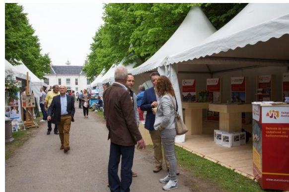
Erfgoedfair landgoed Beeckestein, Velzen Zuid (foto boven).

De Vakgroep Restauratie besluit in 2016 toe te treden tot de nieuwe koepel Nederland Monumentenland, waarin diverse erfgoedorganisaties gezamenlijk optrekken om publiek en professionals te informeren over erfgoed. Hierbinnen vallen de Open Monumentendagen, het Nationaal Monumenten Congres, de Erfgoedstem en de Erfgoedfairs.